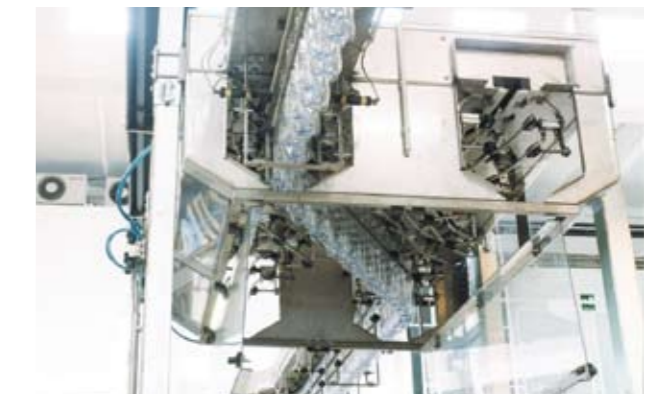
Exchanger from 2 to 2 ways. Scambiatore da 2 a 2 vie.

Portelle di ispezione a distanza ravvicinata per il lavaggio manuale della camera di soffiaggio sono una caratteristica standard. Un sistema di lavaggio automatico dell'interno della camera di soffiaggio con ugelli ad elevata azione meccanica è disponibile come optional per linee aseptiche.